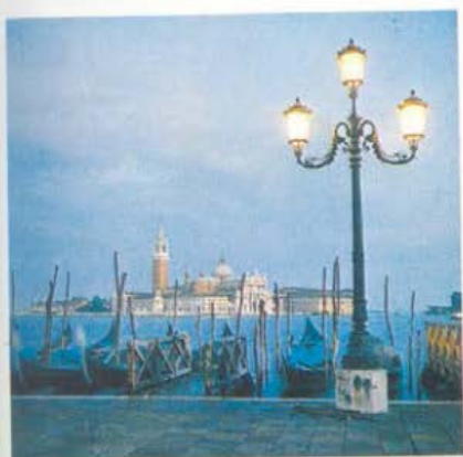
La isla de San Jorge.

Consejería de Educación, Universidades, Cultura y Deportes